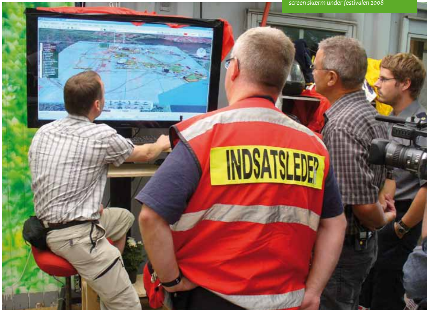
Demonstration af 3D-omgivelse på en touch-screen skærm under festivalen 2008